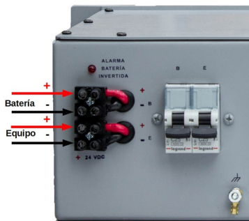
Borne de tierra

El led ALARMA BATERÍA INVERTIDA debe permanecer apagado. En caso contrario, verificar la polaridad de las conexiones al banco de baterías.